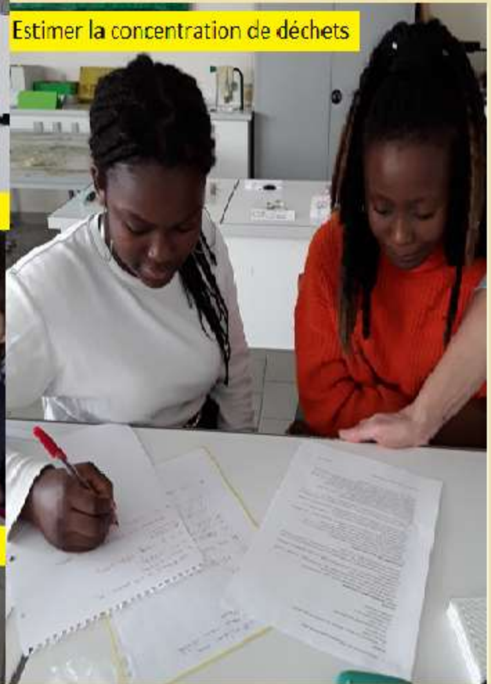
Estimer la concentration de déchets