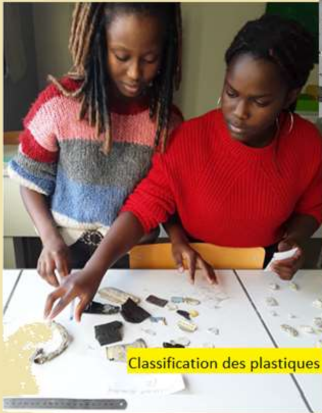
Classification des plastiques